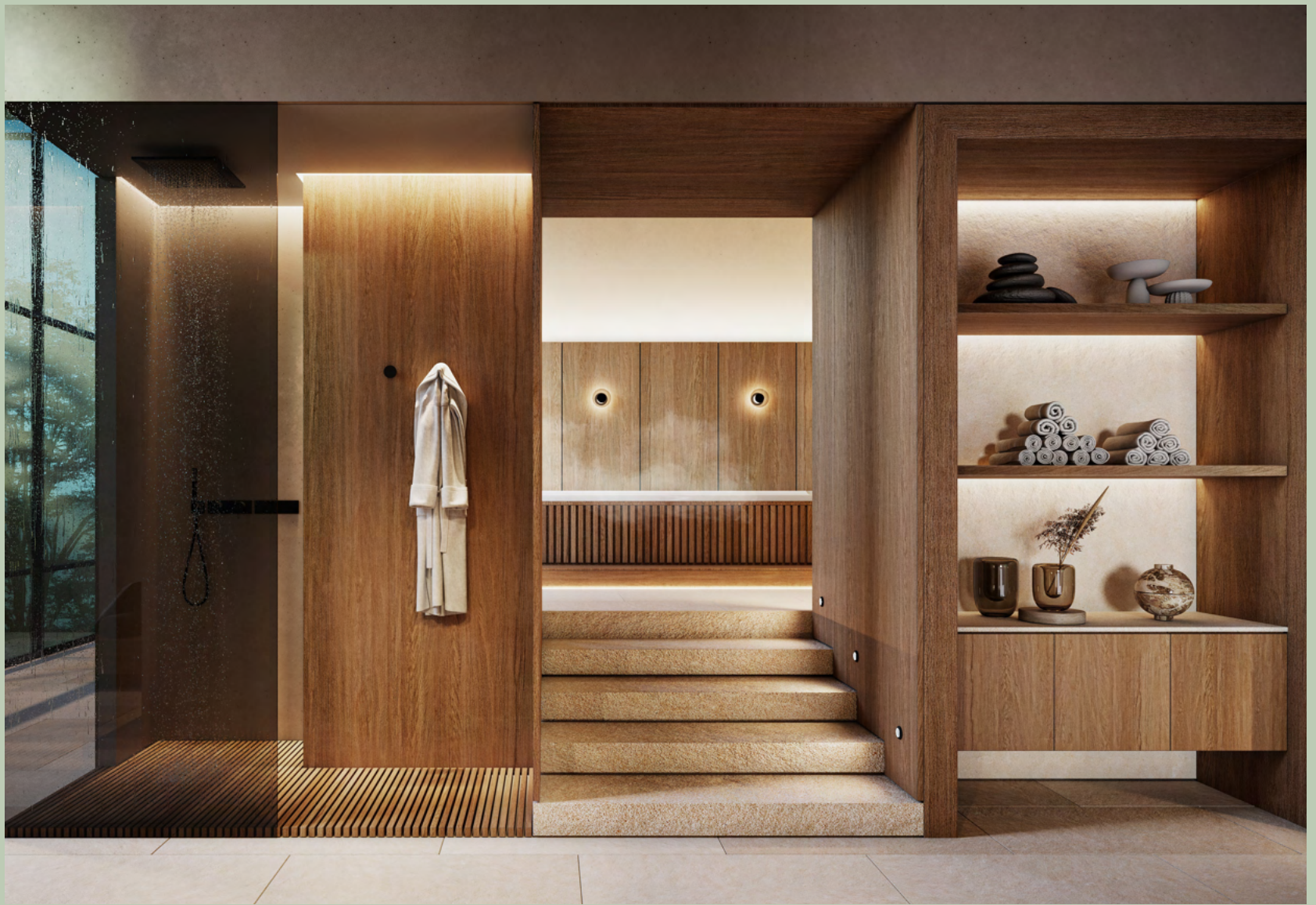
( WELLNESS AREA )

La Wellness Area de Blau es un espacio diseñado para brindar a los residentes exclusiva relajación y bienestar.