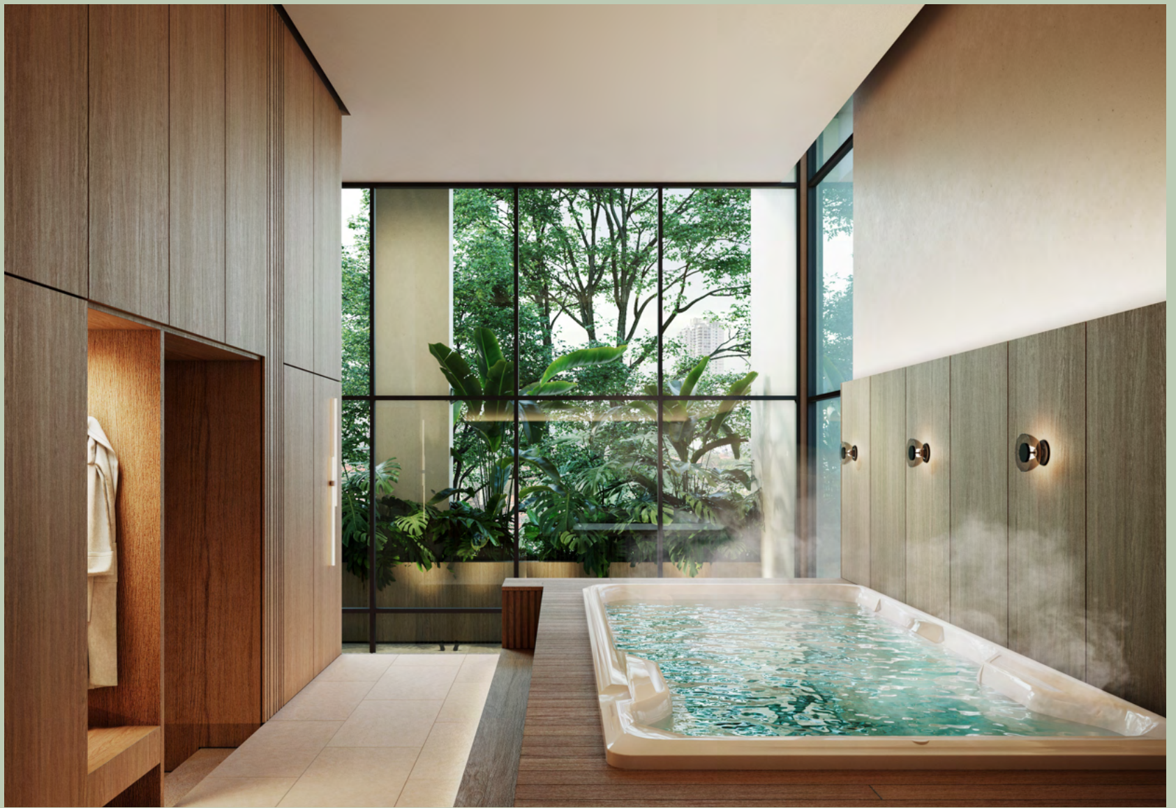
( SWIM SPA )

Un espacio diseñado para la recuperación y la relajación, proporcionando a los residentes un entorno ideal para revitalizar cuerpo y mente. Pensada como una extensión del bienestar integral que Blau ofrece, la Swim Spa está equipada para favorecer la regeneración muscular y la relajación profunda , complementando tanto el ejercicio físico como la rutina diaria.